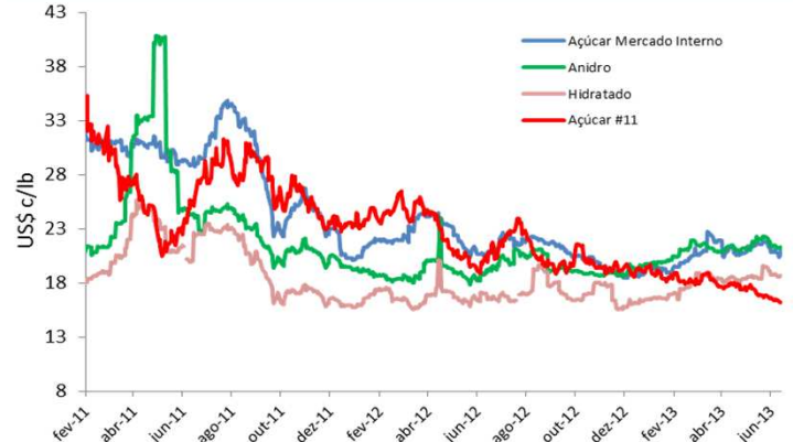
Região Centro-Sul (Base Ribeirão Preto/SP)