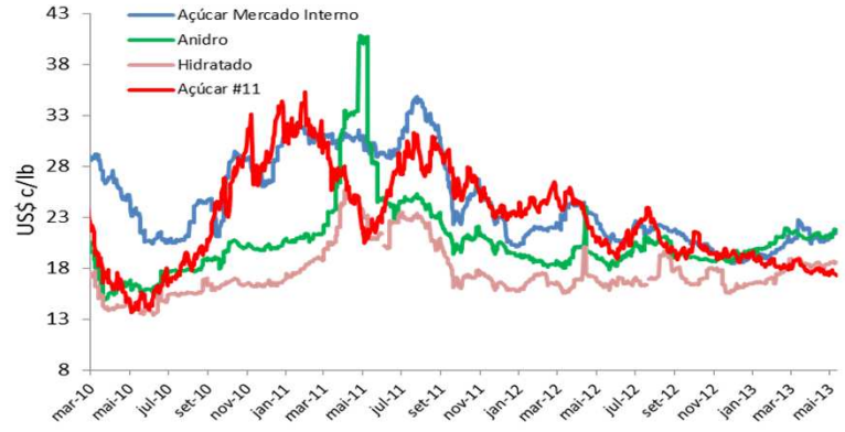
Região Centro-Sul (Base Ribeirão Preto/SP)