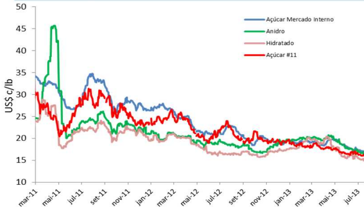
Região Centro-Sul (base Ribeirão Preto, SP)