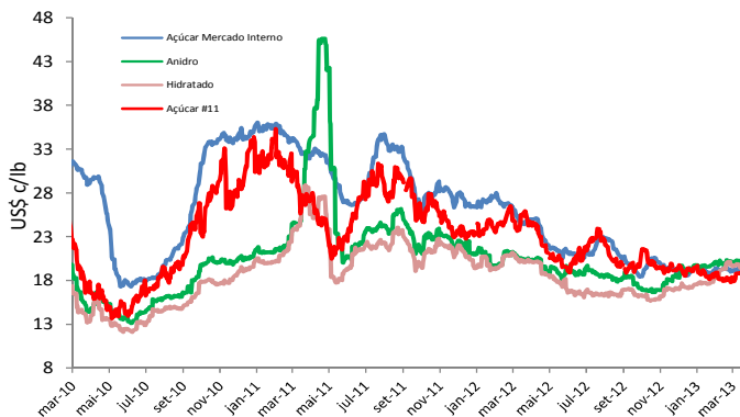
Região Centro-Sul (base Ribeirão Preto, SP)